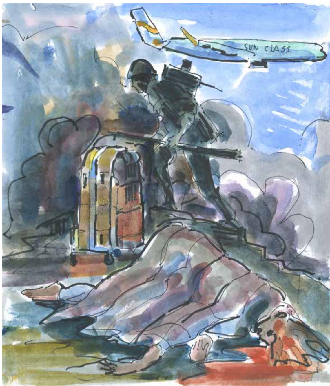
Akvarel af Allan Herrik juni 2023