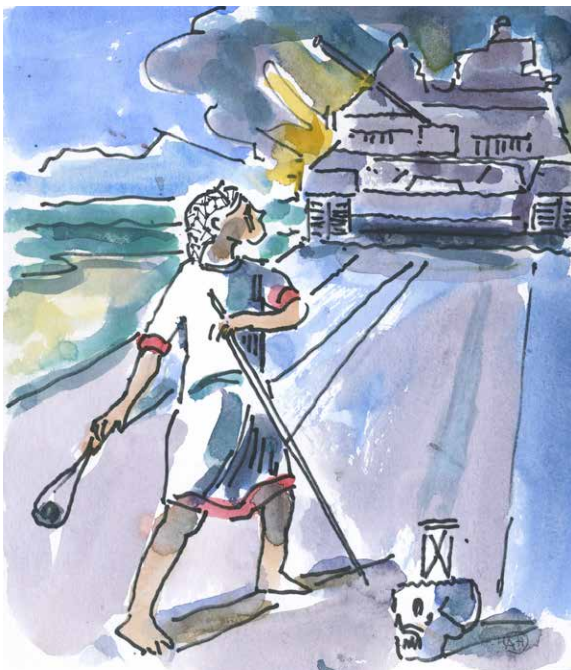
Akvarel af Allan Herrik juni 2024