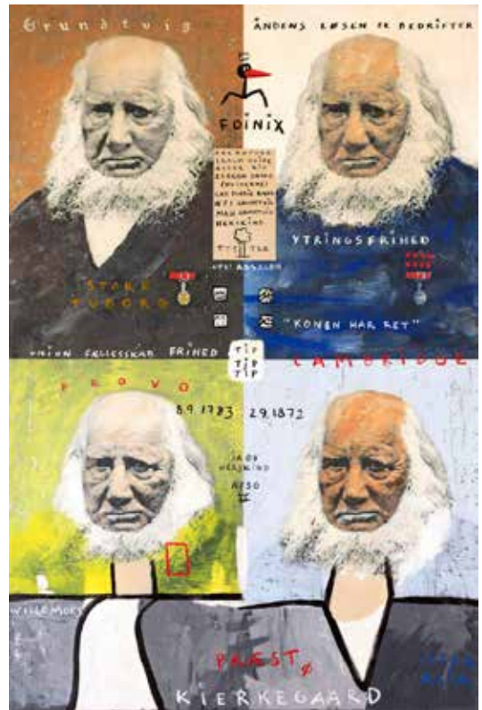
Grundtvig som politiker, Grundtvig som salmeskriver, Grundtvig som skolemand og Grundtvig som præst.