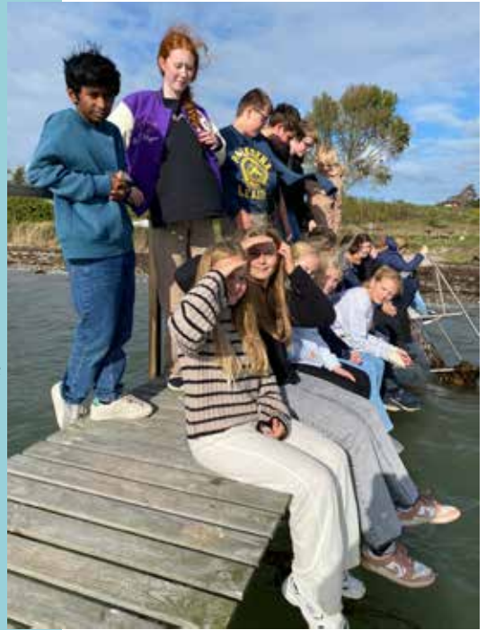
Konfirmander er kirkens »guld«

Når kirkebladet udkommer, er vi allerede i gang med at mødes hver tirsdag morgen kl. 8 i konfirmandstuen. Her i sensommeren mødtes vi til pizzagudstjeneste og til jazz gudstjeneste. Og som noget af det første skal vi altid gå en tur langs stranden langs Føns Vig. I år fik alle konfirmanderne den opgave at finde en hulsten. I første omgang ser det ud til ikke at kunne lykkes. Men som minutterne går, så kommer de glædestrålende løbende og viser den ene hulsten frem efter den anden. Efter hyggeturen langs stranden gik vi op til Føns kirke og kiggede på de forskellige sten. På en måde ligner stenene med huller i os mennesker: vi har alle »ømme punkter«, skjulte sider og en tomhed at bære på. Derfor skal vi være varsomme med hinanden. Og Kunsten er at få øje på, at Gud har valgt at elske os med alle de fejl og mangler, vi har.