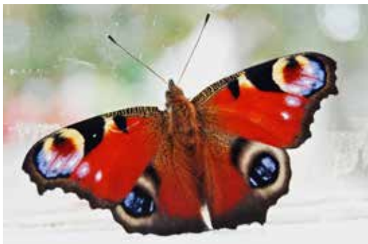
Vi vil da have sommerfugle i Danmark og i verden

»I kan ikke tjene både Gud og mammon, siger Jesus et andet sted«. Vi ser det allertydeligst i forhold til naturen og våbenindustrien. I al for lang tid, har vi som mennesker betragtet os som herskere, og med utrolig snilde har vi villet udnytte alle jordens ressourcer, og vi har brugt milliarder på våben. Der er andre veje at gå. I en podcast fortalte en sommerfugleentusiast sorgfuldt om, at vi her i Danmark næsten har udryddet alle sommerfuglene. Og det samme fortæller biavlerne om bierne. Marshall hjælpen efter anden verdens krig lærte os at bryde voldspiralens onde cirkel, den lærte os at investere i fred og ikke i krig. Vi skal gå med forundringsbriller i stedet for med forbrugsbriller. Vi skal tale væksten imod, vi skal vækste i tro håb og kærlighed og ikke i tilfældige ting og sager, og vi skal turde investere i fred med retfærdighed.