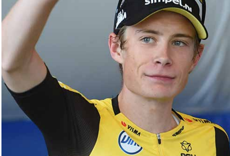
Den kreative frie tilbagetrækning - Jonas Vingegaard

Det er altså ret vildt det med, at de sidste skal blive de første: op igennem århundrederne var det jo børnene og kvinderne, der var de sidste. Jesus skaber med sine ord - en ny vej, en ny bro at gå videre af, kvinderne og børnene skal med i inderkredsen: Jesus valgte ikke at bruge vold og magt og våben for at skabe den nye fremtid, Jesus valgte sproget - kommunikationen - ordene - ofte meget poetiske ord og fortællinger. Poesi kommer af det latinske ord: Poesis - som betyder at frembringe, at skabe og at forme og at danne. Det er det ordene kan. Jesus var og er med til at forme den kommende verden. Vi kunne sige, at den vej han beskriver er: den frie kreative tilbagetrækning til fordel for andre, den visdom at skabe livsrum for andre end sig selv. Det allerbedste eksempel i denne sommer er Jonas Vingegaard. Skal han lade sin hjælperytter vinde, eller skal han selv gå efter sejrstrøjen? Skal han træde til side, eller skal han vise, at han er kaptajnen? Det kræver øvelse og mod at give andre plads. I dag ved vi, at han valgte den frie kreative tilbagetrækning. Det kan vi godt tage ved lære af.