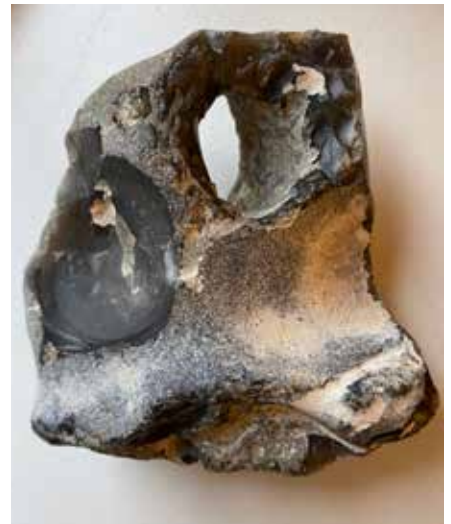
Vi mennesker har også »ømme punkter« og vi bærer alle på erfaringer af »tomhed«