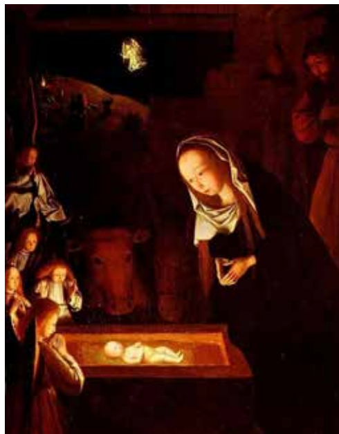
Det særlige lys julenat fra 1490 af Geertsen Tot Sint Jans

Vi prøver noget nyt, vi mødes i skumringen – Vita