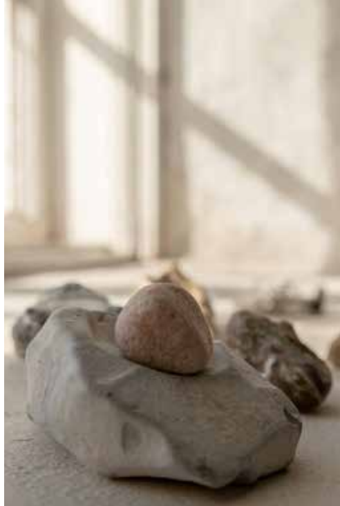
Mærk roen i kirkerummet