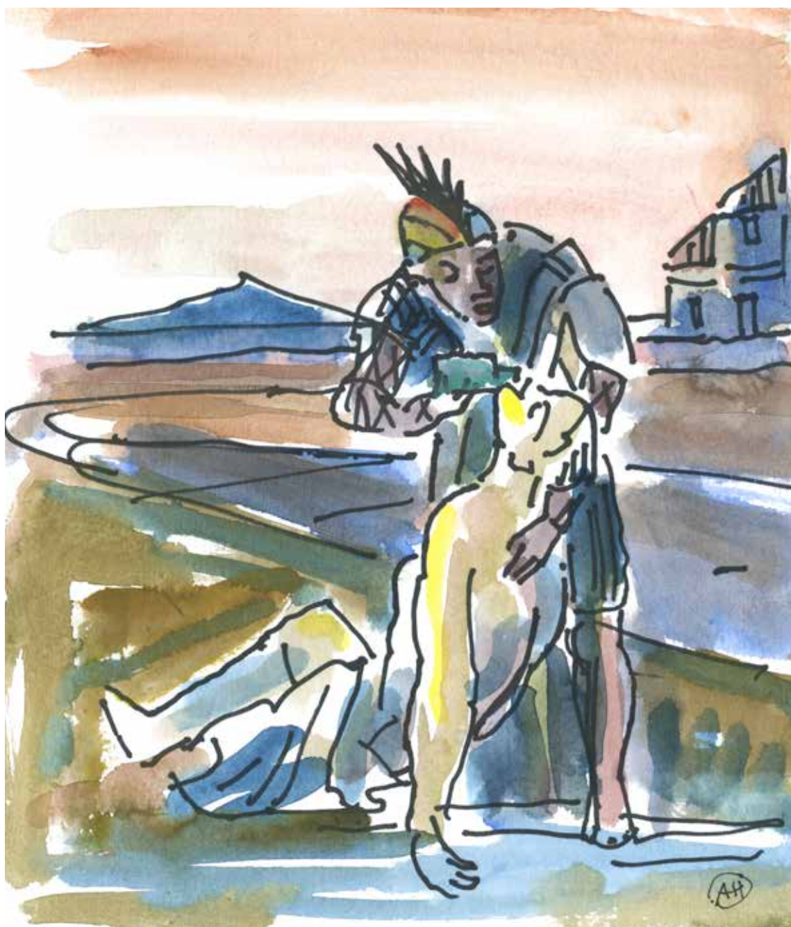
Akvarel af Allan Herrik oktober 2024